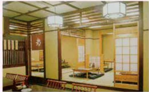
和風レストラン都亭

ご利用を希望されます会員事業所様は、当協会のホームページから「施設利用会員証交付申請書」をダウンロードしてお申し込みください。